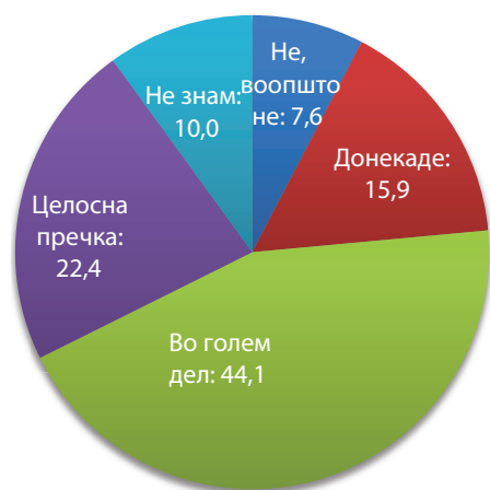
Графикон 2. Нивојто на корупција претставува голема пречка за фирмиџе

Забелешка: Категоријата „повеќето“ плус „во целост“ формираат 65,5%.